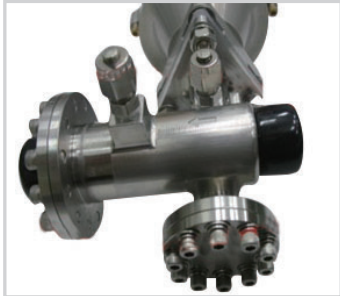
발명자 | 정태규 책임연구원 (발사체추진제어팀)

원하는 유체의 유량을 필요에 따라 조절할 수 있고, 급격한 시스템 부하의 변화와 상관 없이 항상 일정한 유량이 흐르도록 제어함